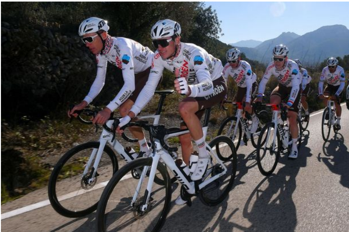
AG2R・シトロエン・チーム_1

HJCは1971年創業以来、ヘルメットの専門メーカーとして開発、製造を行ってきており、モーターサイクル用ヘルメットでは世界で高いシェアを保ち続けています。同社は2018年よりサイクル用ヘルメットに参入し、モーターサイクルで培った技術を活かした製品を投入しています。