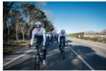
AG2R・シトロエン・チーム_2