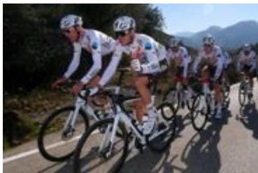
AG2R・シトロエン・チーム_1